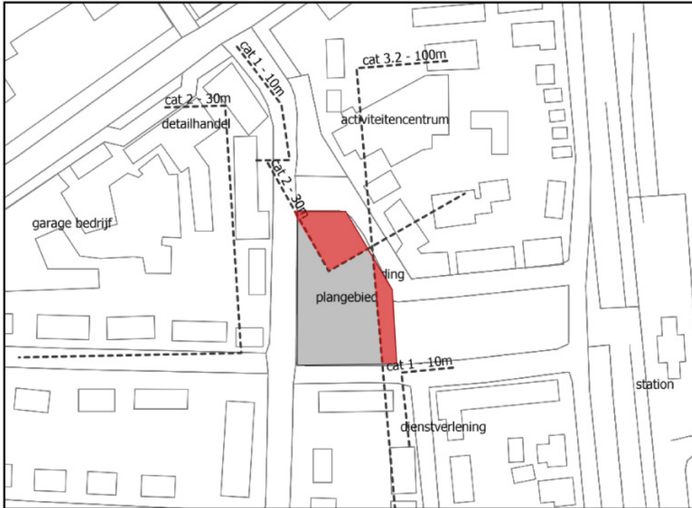
Figuur 3: overlap aandachtgebieden – plangebied

Voor de twee inrichtingen is zeer waarschijnlijk het Activiteitenbesluit van toepassing en in het aandachtsgebied liggen bestaande woningen. Indien bij deze woningen voldaan wordt aan de normstelling van Activiteitenbesluit dan zal dit ook het geval zijn bij de nieuw te bouwen woningen. Zodoende hoeft woningbouw op de onderzochte locatie geen beperking hoeft te vormen voor de bedrijfsvoering van de inrichtingen. Dit dient echter wel aangetoond te worden.